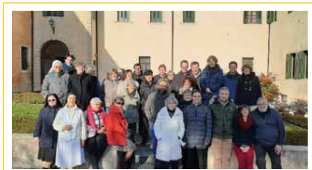
Esercizi Natale 2022